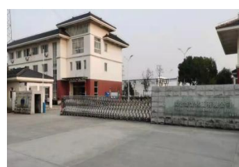
太仓维龙化工有限公司

位于苏州高新区，占地近 100 亩，是公司投资新建子公司，是主要生产销售基地之一。