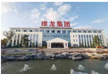
苏州市维龙新材料实业集团有限公司