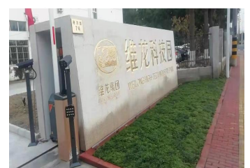
苏州工业园区维龙科技有限公司

位于国家级经济技术开发区----太仓港港口技术开发区，占地 100 余亩，具备多种助剂的开发生产成熟装置和体系。